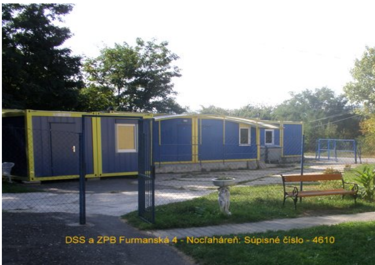
DSS a ZPB Furmanská 4 - Nocľahareň: Súpisné číslo - 4610