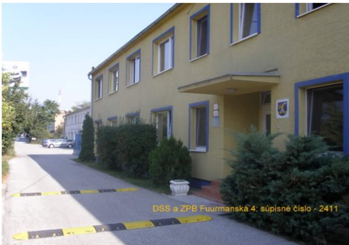
DSS a ZPB Furmanská 4: súpisné číslo - 2411